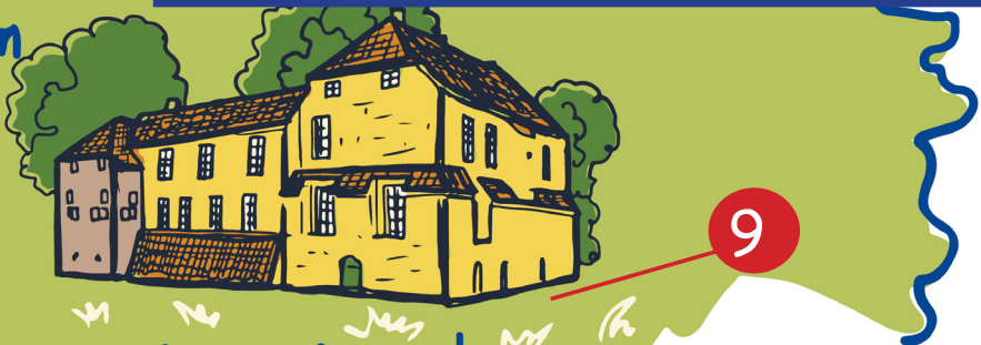
● Manningaburg Pewsum