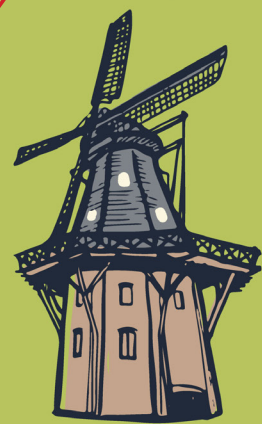
● Mühle Rysum