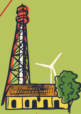
● Campener Leuchtturm