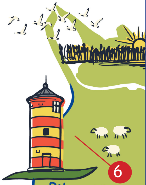
● Pilsener Leuchtturm