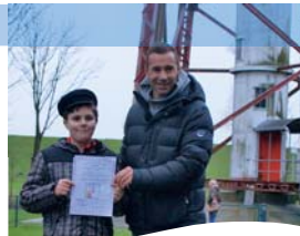
Fernsehstar Kai Pflaume von "Klein gegen Groß" zu Besuch bei unseren Leuchttürmen.

Im Maschinenhaus befindet sich auch unser Kassen- und Infobereich. Hier erhalten Sie neben warmen und kalten Getränken auch Eis sowie Souvenir-Artikel!